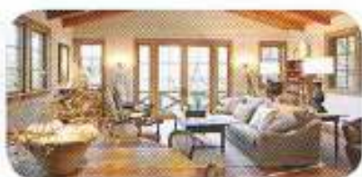
In Ferienwohnungen lohnt der Einbau einer Zentralheizung oft nicht, oder ist nicht praktikabel.