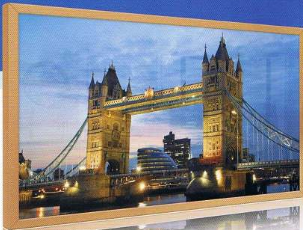
Infranomic® Hezelement, Motiv «Tower Bridge», Massivholzrahmen Buche